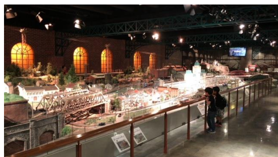
※世界最大級の一番ゲージジオラマ「いちばんテツモパーク」