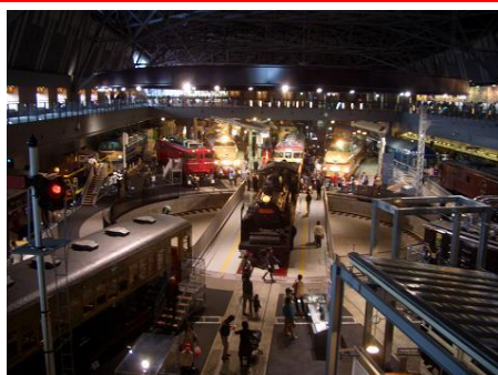
※本館 1F 車両ステーション