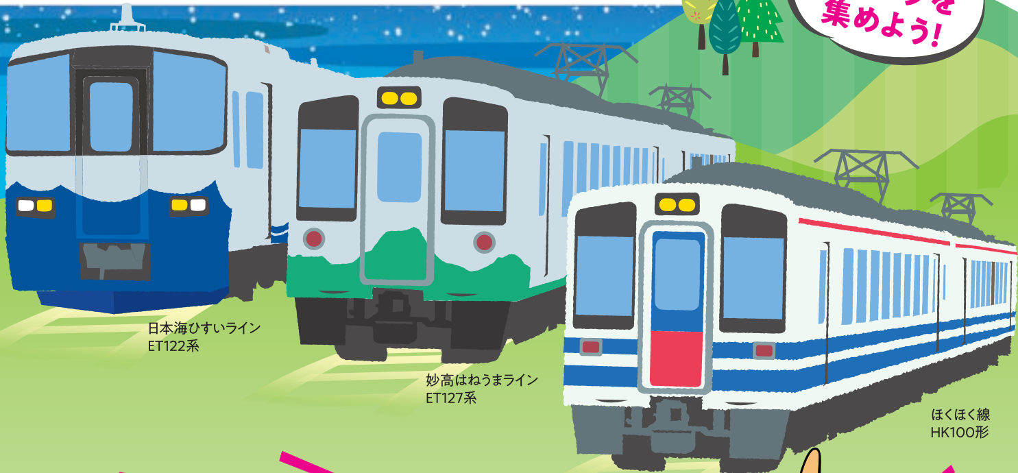
日本海ひすいライン ET122系