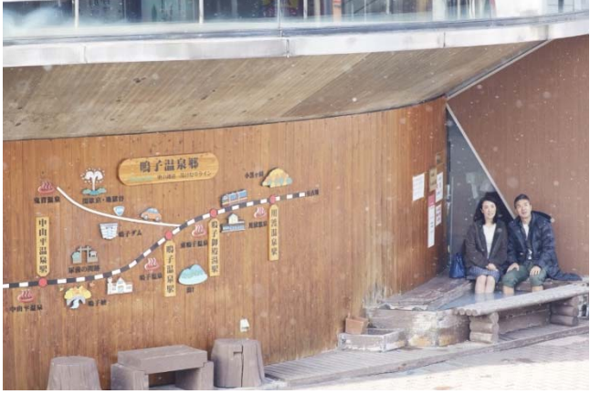
鳴子温泉駅に併設されている足湯