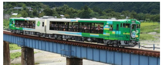
びゅうコースター風っこ（イメージ）

※東京駅発着で2名様以上1組で出発した場合の料金です。その他の駅発着の商品や、おとな1名様出発の商品もございます。