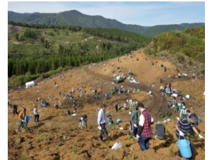
森づくりの様子（昨年）