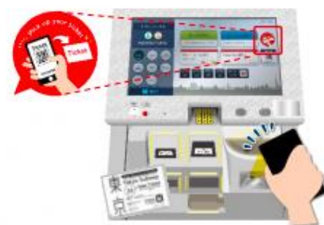
旅行者向け券売機

■「EX 旅のコンテンツポータル」についてはJR東海ホームページをご確認ください。