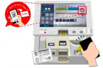
旅行者向け券売機

引換えQRコードによる発券に対応した旅行者向け券売機に、QRコードをかざすことでTokyo Subway Ticketを発券できます。 旅行者向け券売機の設置駅は、以下の路線図をご覧ください。