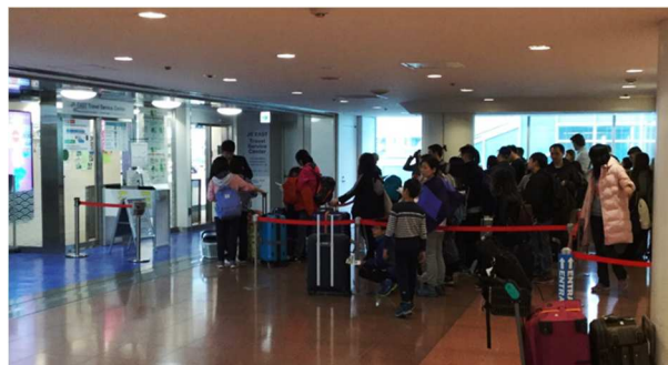
訪日外国人向け鉄道パスの取扱枚数