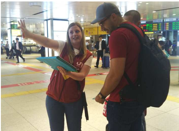
外国語案内スタッフ

(2018年6月1日現在、34名のうち外国籍は17名で、国籍は中国、ウズベキスタン、カザフスタン、エジプト、イタリアなど)