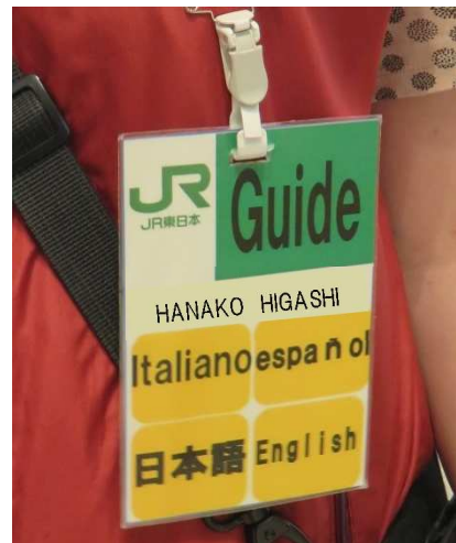
名札に対応可能言語を記載