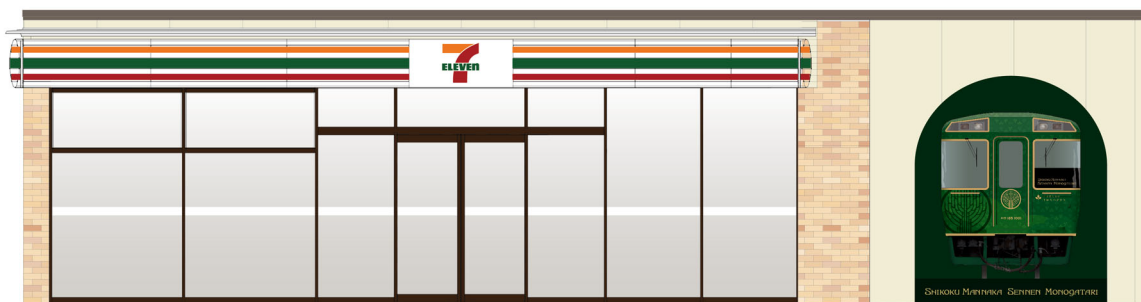
店舗正面（駅前広場側）