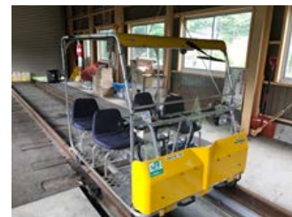
【レールスター(イメージ)】