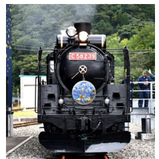
【記念撮影スポット(イメージ)】