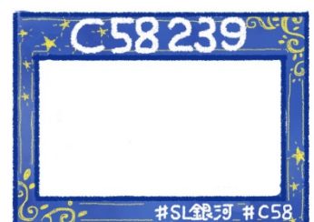
【フォトフレーム(イメージ)】