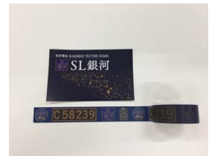
【SL銀河マスキングテープ(イメージ)】