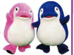
ラッピング電車のデザイン