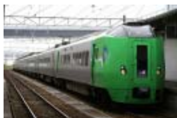
「ねぶたエクスプレス」に使用する789系特急電車