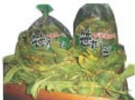
「笹だんご 10ヶ入（袋）」 （株）新川屋

良質な水稲もち米、昔ながらの蒸籠創り、良質な水を使用し丁寧に作り上げました。笹の葉のさわやかな香りも一緒にお召し上がりください。