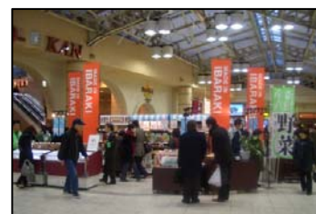
<産直市イメージ写真>