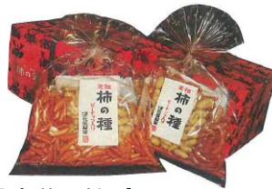
「巾着 柿の種 160g」 浪花屋製菓（株）

良質な水稲もち米、昔ながらの蒸籠創り、良質な水を使用し丁寧に作り上げました。笹の葉のさわやかな香りも一緒にお召し上がりください。