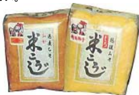
「越後みそ 米こうじ（赤・白）1kg」 山崎醸造（株）

うま味の中に辛さが走る。辛味の中にも味噌の美味しさが広がるのが特徴です。（緑）辛さが熟す前の緑のうちに採った神楽南蛮（赤）辛さが熟した赤い神楽南蛮