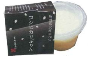
「コシヒカリぷりん」 （株）喜太郎商店

「元祖 柿の種」とピーナッツを一緒の巾着に入れました。柿の種は、いつもの美味しさそのままに、ピーナッツのアクセントをくわえ、おやつにはもちろん、ビールのおつまみにもぴったりなお味に仕上げました。