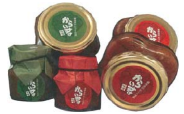
「からいすけ」 （合）からいすけ本舗

とびうおが最も味のよい6月に佐渡沖で水揚げされたもののみを用い、焼いて乾燥した後、必ず半年以上ねかせ風味がまるやかになったところで仕込みます。あっさりしながらも深みのある味が特徴です。