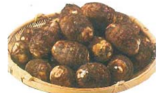
「さといも（帛乙女）」 J A新潟みらい