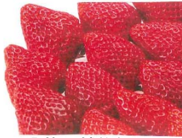
「苺（越後姫）」 J A新潟みらい

粒が大きく、濃厚な甘味のある苺。傷つきやすいため、東京に出荷することがめったに無い「幻の苺」です。