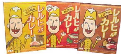
「レルヒカレー（上越、妙高、湯沢）」 （株）オリエンタル

（赤）大豆の持つうま味を十分に引き出した、風味豊かな米こうじ赤みそ。 （白）米こうじを豊富に使用し、舌触りもなめらかで色鮮やかな白みそ。