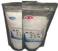
「佐渡の深海塩 一番塩 160g（左） 荒塩 180g（右）」 佐渡海洋物産（株）

ミネラル豊富な佐渡海洋深層水を100%使用。一番塩は天ぷら、おにぎり、浅漬けに最適です。また、粗塩は、焼肉、焼鳥、焼魚、枝豆の仕上げ、野菜サラダなどに適しています。大雑把にパラパラふりかけてお召し上がりください。