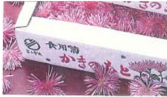
「かきのもと」 J A新潟みらい

粒が大きく、濃厚な甘味のある苺。傷つきやすいため、東京に出荷することがめったに無い「幻の苺」です。