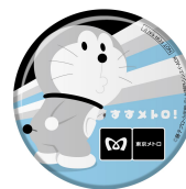
〈オリジナルグッズイメージ（ステッカー・缶バッジ）〉