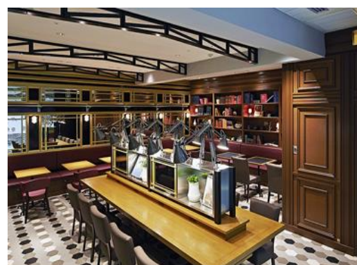
Echika fit 永田町 カフェテリアスペース