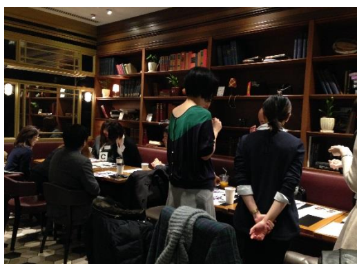
前回開催時の様子

軽い食事やコーヒーなどを飲みながらリラックスした雰囲気、ちょっとまじめなビジネス英会話レッスン。外国人講師を交え、初心者向けの分かりやすいビジネス英会話を自由な雰囲気でご体験いただけます。