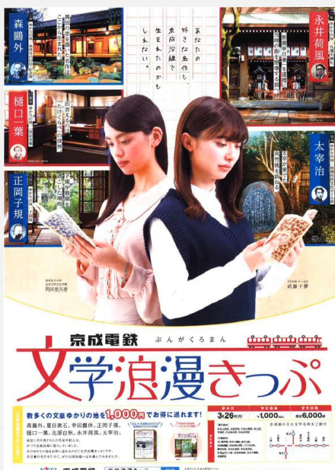
(ポスターデザインイメージ)