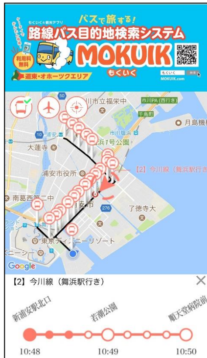
タップしたバスの運行情報