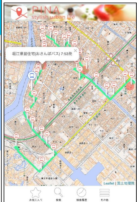
「もくいく」から起動したWeb版