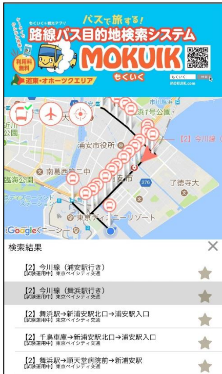
地図をタップして検索