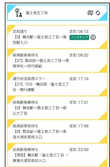
最寄停留所のバス一覧表