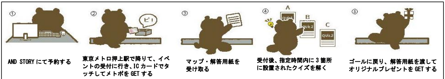
メトポの進呈、及びイベントの流れ