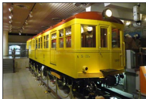
※地下鉄博物館に展示されている1000形車両 ※銀座線の名称は1953年から使用開始