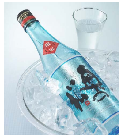
奥の松酒造 吟醸原酒