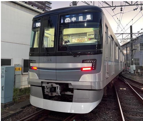
長期評価を実施した日比谷線13000系車両