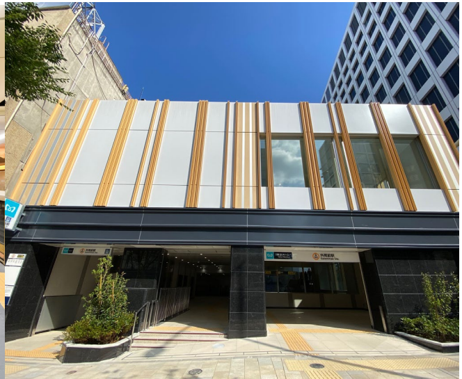
左：京橋駅ホーム、右：外苑前駅出入口