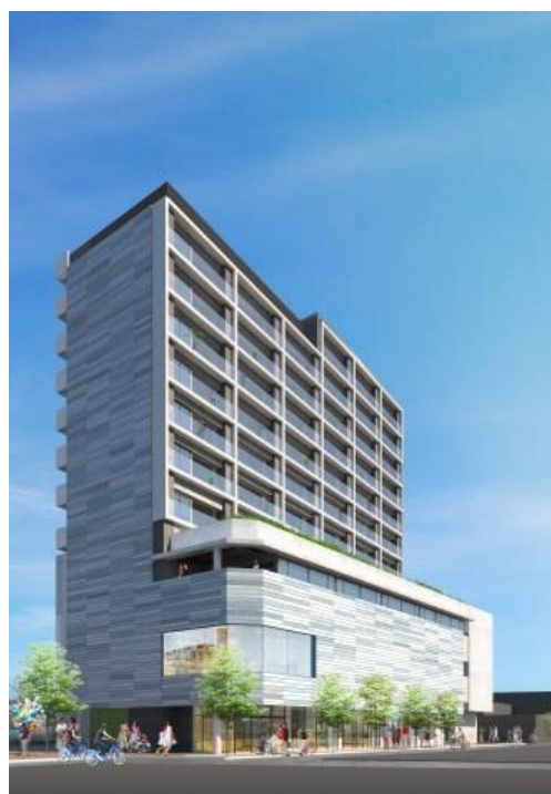
(仮称)東長崎駅南口計画 完成予想図

これからも西武線沿線にお住みいただく“きっかけ”をご提供するとともに、住み続けていただけるような魅力づくりを通じて沿線の価値向上に努めてまいります。