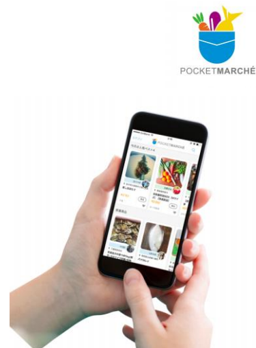
「ポケットマルシェ」WEB ページ