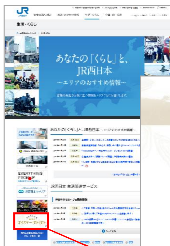
JR 西日本 HP 「生活・くらし」のバナー