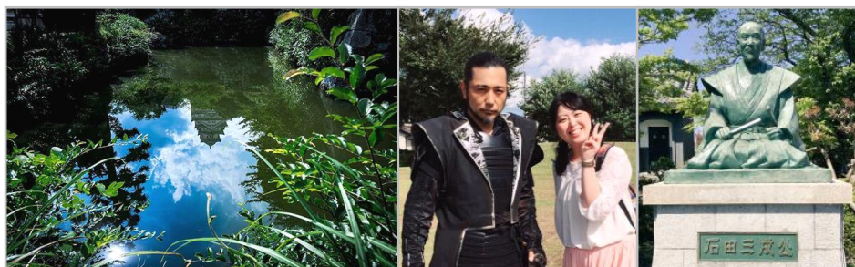
フォトジェニック賞