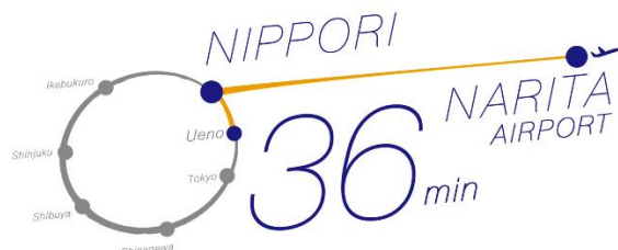
新しいテレビCMのイメージ