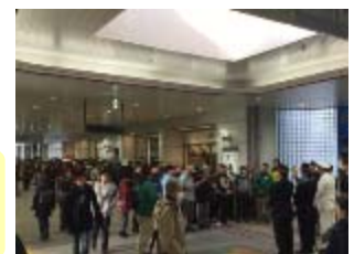
<昨年の三社共同開催時の受付>