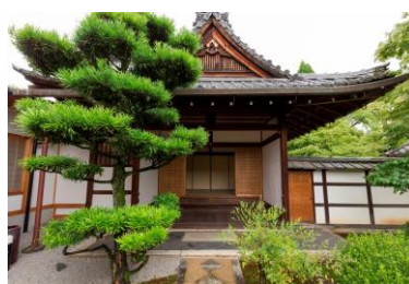
相国寺 豊光寺（外観）