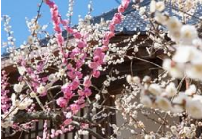
相国寺 林光院 鶯宿梅