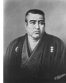
西郷隆盛肖像画 (国立国会図書館蔵)