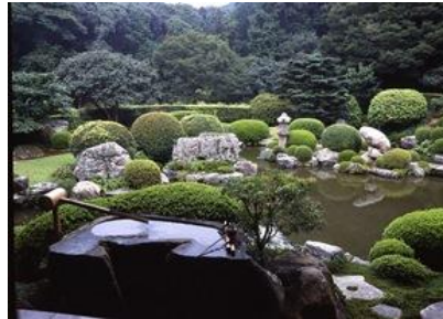
清水寺 成就院 月の庭