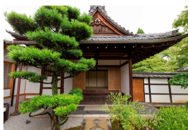
相国寺 豊光寺（外観）