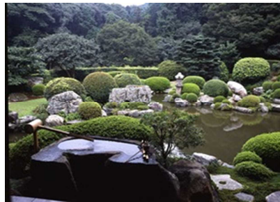
清水寺 成就院 月の庭