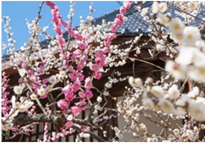
相国寺 林光院 鶯宿梅