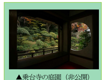
▲乗台寺の庭園（非公開）