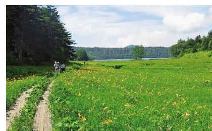
福島県檜枝岐村 尾瀬国立公園