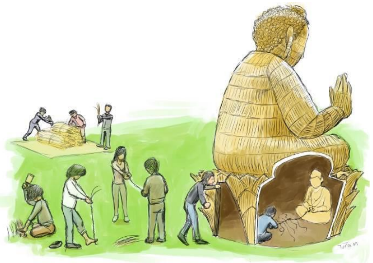
「わらで縄づくり わらアート入門」(イメージ)