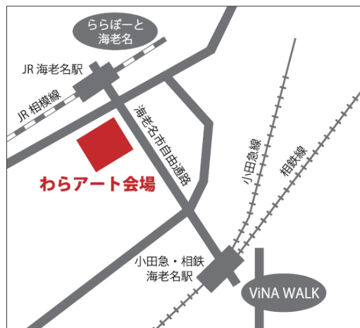
各イベント開催場所 地図