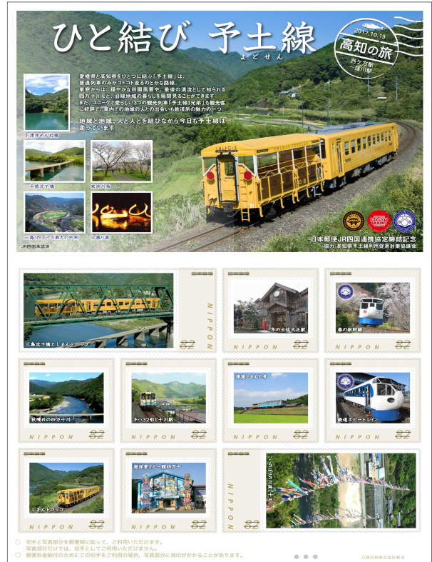
予土線オリジナルフレーム切手