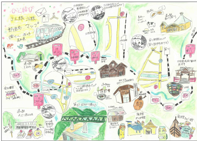
予土線オリジナルマップ