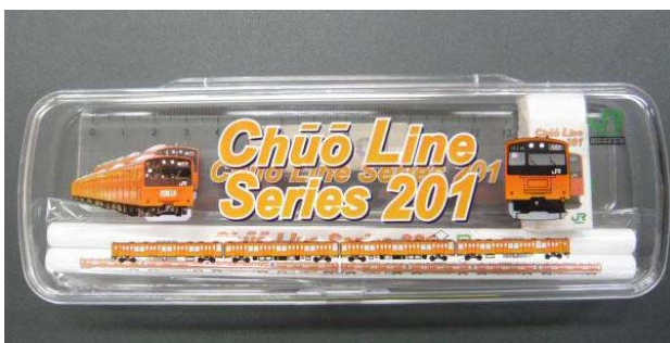
「中央線201系文具セット」（イメージ）