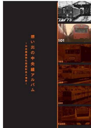
記念入場券台紙（イメージ）