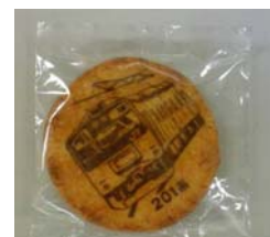
中央線 201 系草加せんべい (イメージ) 500 円(5 枚 1 セット)