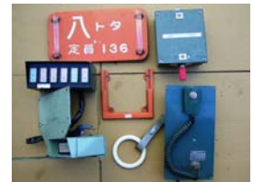
鉄道部品(イメージ)

*鉄道部品の商品点数は、34種類134点(使用済み)を販売する予定です(オークション対象7種類13点、オークション対象外27種類121点)。なお、中央線201系の未使用の鉄道部品も、販売する予定です。