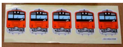
中央線 201 系シール(イメージ)100 円