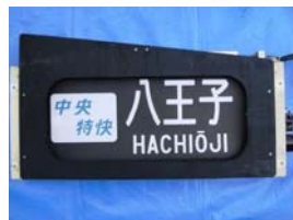
行先表示器(イメージ)