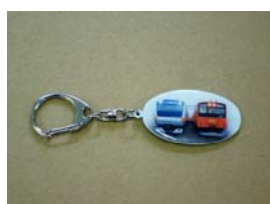
中央線 201 系/E233 系 キーホルダー(イメージ)600 円