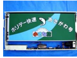
前面種別表示器(イメージ)