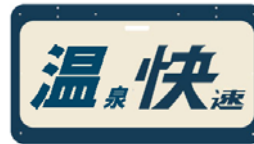
ヘッドマーク(イメージ)