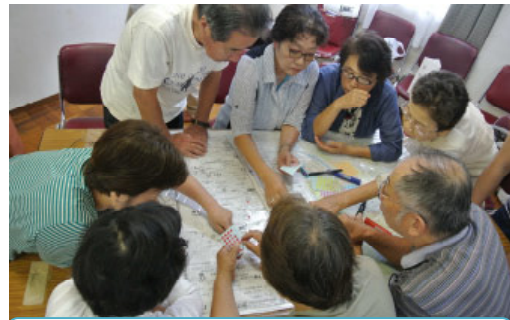
災害弱者の避難を考えた防災マップづくり