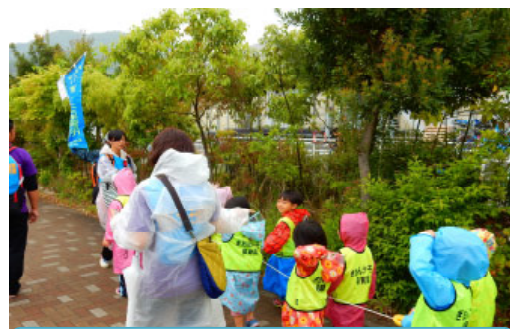
幼保育園児の避難訓練(広島市)