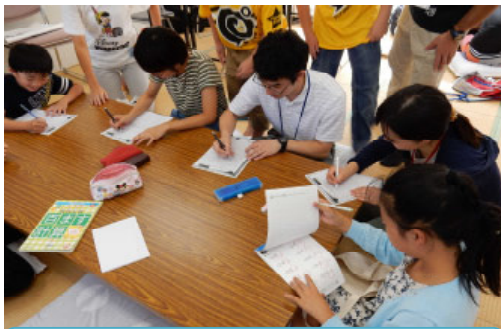
学生による被災地の子ども達への学習支援活動