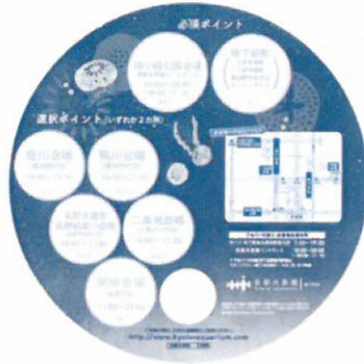
【スタンプラリー台紙】(イメージ)

平成29年7月20日 京都市交通局 自動車部営業課 TEL 863-5161 高速鉄道部営業課 TEL 863-5218 公立大学法人京都市立芸術大学 連携推進課(事業推進担当) TEL 334-2204 京都水族館 広報チーム TEL 354-3116