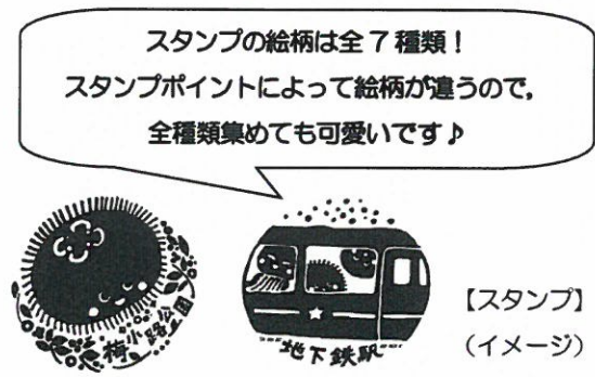
【スタンプ】 (イメージ)

イ 全7箇所のスタンプポイントのうち、必須ポイント2箇所及び選択ポイント2箇所の計4箇所を回り、スタンプ台紙にスタンプを押します。