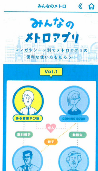
「みんなのメトロアプリ」画面イメージ