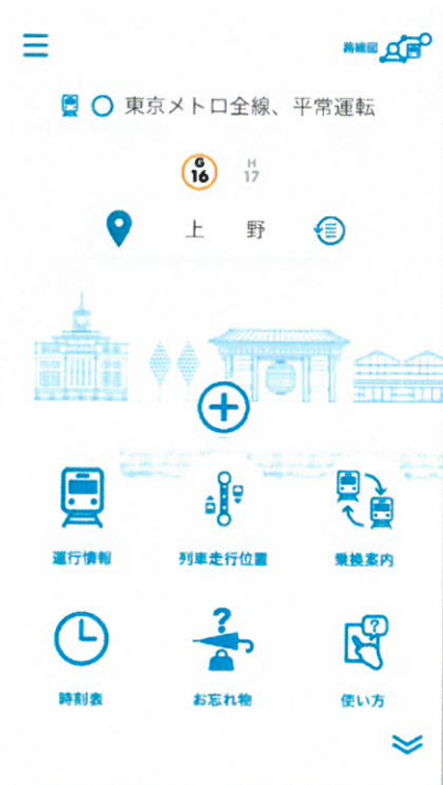
「アプリ TOP」画面イメージ