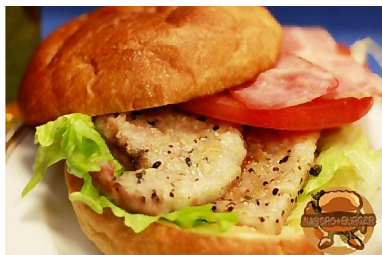
↑なよろバーガー(イメージ)