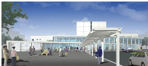
↑稚内新駅舎イメージ