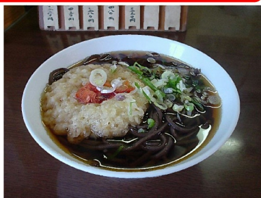
↑音威子府そば(イメージ)

オプションで あなたの名前が 入った エンブレムタイプ 記念乗車証も ございます。 (+5,000円) 3月15日までに 事前申込が必要です。 参加者限定。 ※下図は イメージです。