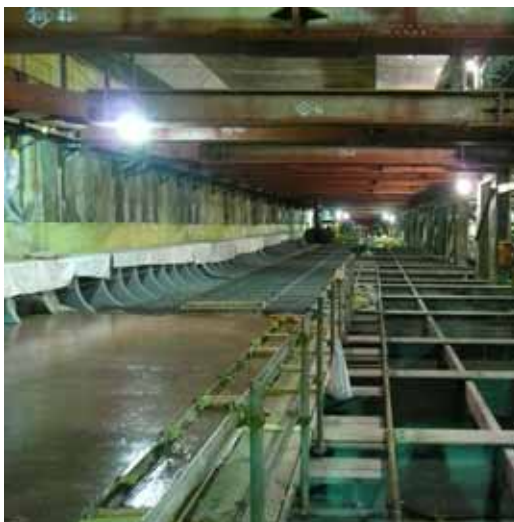
見学いただく地下トンネル(現在の様子)