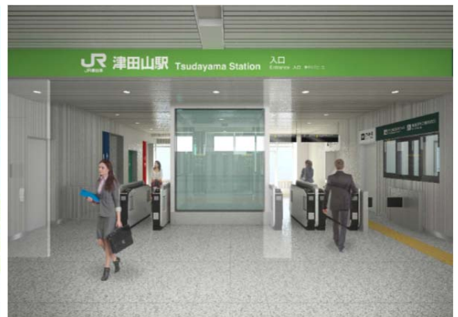
改札入口イメージ