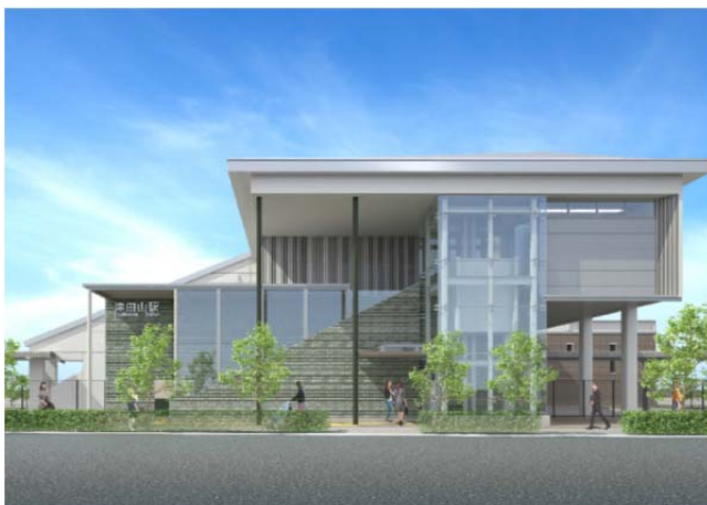
北口外観イメージ