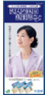
【入会申込書イメージ】