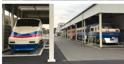
写真左上：引退する3500形未更新車、写真右上：運行当初の3500形 写真左下：掲出するヘッドマーク、写真右下：宗吾車両基地内の保存車両