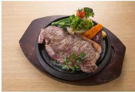
ぶどうの樹 600gメガトンステーキ～6種類のソースで味わおう!!～ 6,666円（税込）