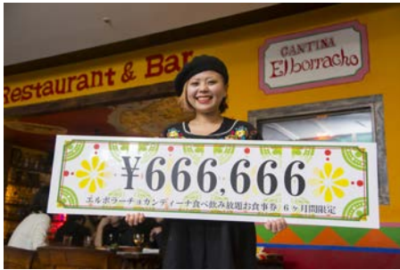
カンティーナ エルボラーチョ 6ヶ月ペア飲み食べ放題チケット 666,666円（税込）

※アミュプラザ1階チョコレートショップ博多の石畳、エノテカでは「6」にちなんだ商品をご用意！ こちらもお楽しみください！