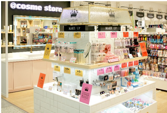
アットコスメストア (1階) 3月3日 (金) OPEN

3周年を迎えたアミュエストも開業以来はじめての全16店舗 (九州初出店2店舗) という大幅リニューアル。通勤・通学で博多を頻繁に利用される女性のお客さまにトレンドファッションを手ごろな価格でご提供する“今ほしい”をこれまで以上にかなえてくれる施設として成長します。