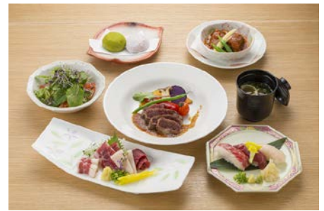
菅乃屋 期間限定6周年特別ランチ 2,880円（税込）