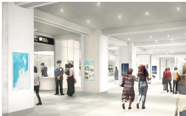
南口改札前イメージ