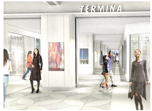
店舗前通路イメージ