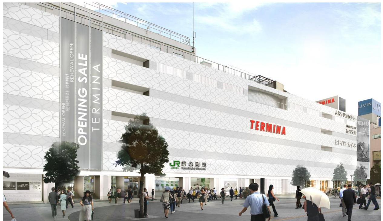
(参考) 南口外観ファサードイメージ