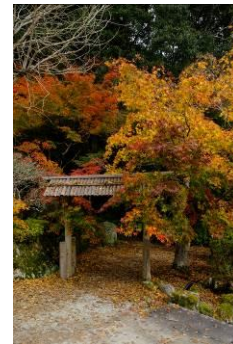
mikichu さん（福岡県） 「赤や黄色の世界への入口」