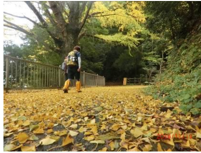
ぼくちゃんさん（福岡県） 「落葉のじゅーたん」