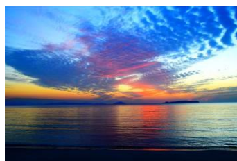
アラスカななつさん（福岡県） 「宮地海岸の夕焼け」