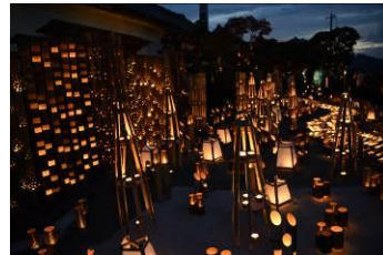
ヨッシーさん（福岡県） 「千年あかり」