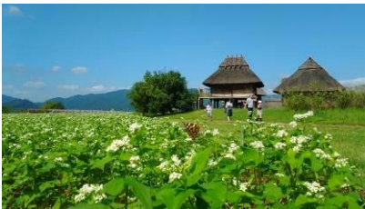
長門のひろさん（山口県） 「そばの花に舞う蝶と吉野ヶ里を歩いて」