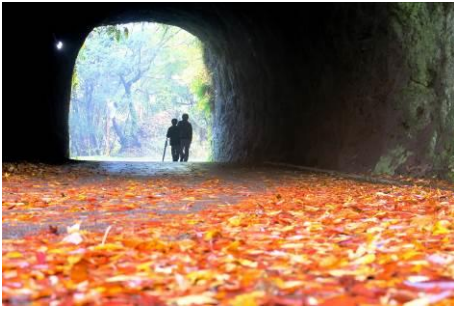
しんちゃんさん（熊本県） 「父子（おやこ）旅」