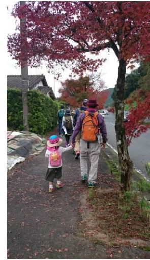
mini さん（福岡県） 「おじいちゃんと私」