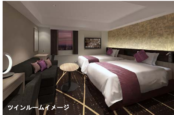
ツインルームイメージ