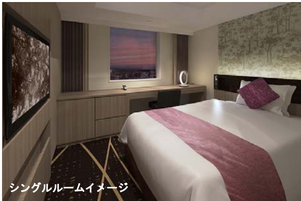
シングルルームイメージ