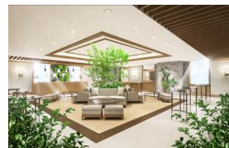
ブライダルロビーイメージ