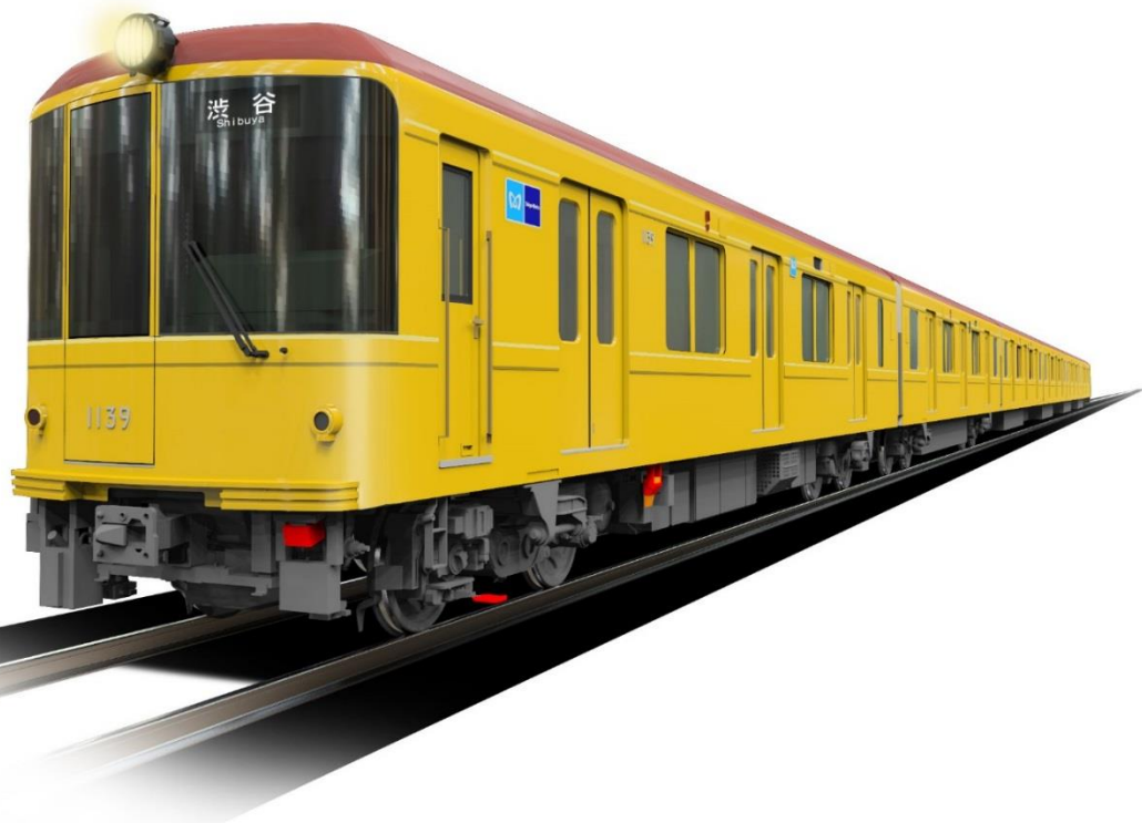
銀座線1000系特別仕様車両外観