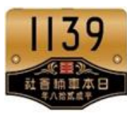
号車・製造者銘板(イメージ)