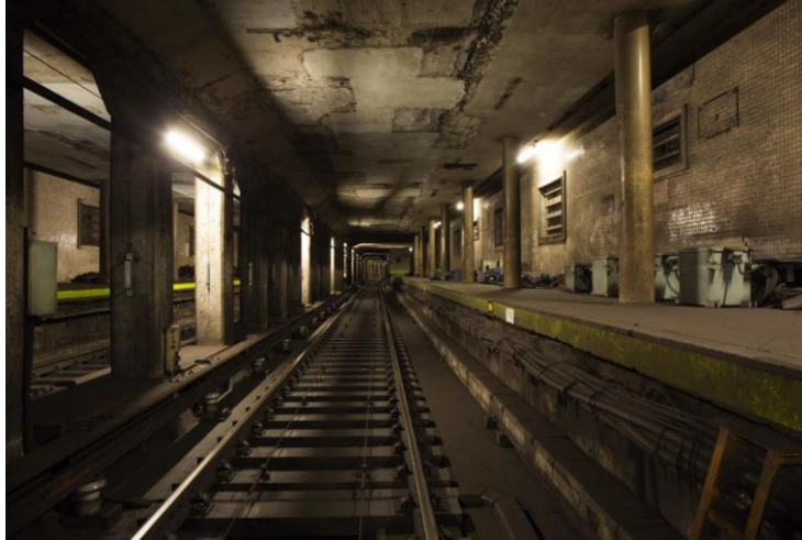
旧表参道駅ホーム

毎回、東京メトロ銀座線の秘密を紹介していく「銀座線探偵団」。第一回目は、表参道駅のホーム奥に今も残る旧表参道駅ホームを、探偵団が調査しました。この旧表参道駅ホームは、約40年前まで実際に銀座線表参道駅として使われており、半蔵門線の工事に合わせてその役目を終了し、今はひっそりと眠っております。普段は入ることができない旧ホームには思いがけない発見も！記事内では探偵団が発掘した旧表参道駅の営業当時の貴重な写真も公開します！