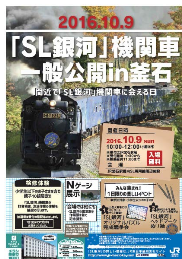
「SL 銀河」機関車一般公開 in 釜石 チラシ(イメージ)