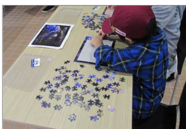
オリジナルパズル完成競争