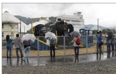
転車台での機関車回転作業を見学