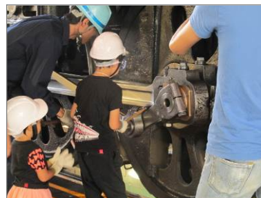
機関車検修体験(イメージ)

「SL 銀河」の検修員と一緒に、機関車の打音検査や注油作業を体験できます。 抽選券は、当日9時30分～10時00分に受付でお渡しし10時15分より会場で抽選します。