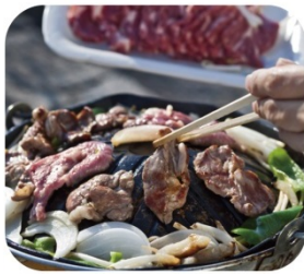
遠野ジンギスカン