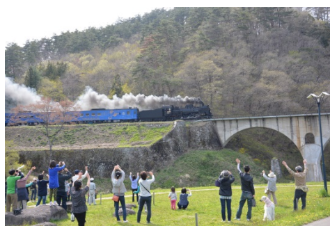
みんなで「SL 銀河」を歓迎しよう！ (画像は 2014 年の運行時の様子)