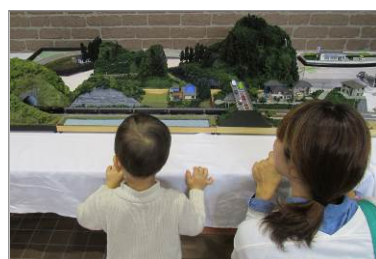
Nゲージ(鉄道模型)展示