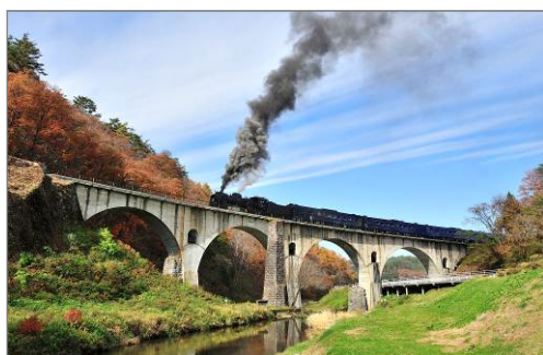
めがね橋を渡る「SL 銀河」下り列車 (当日は上り列車で、画像とは逆向きになります。)