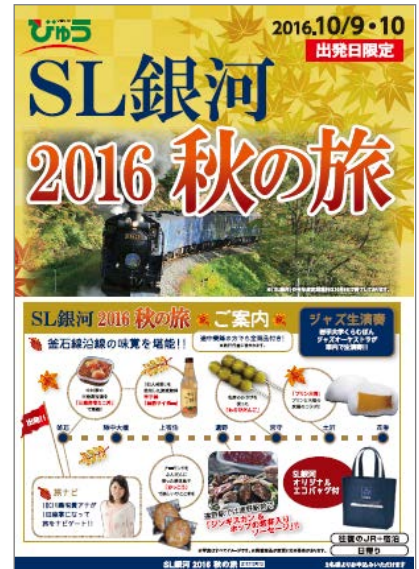
「SL 銀河 2016 秋の旅」 専用パンフレット (イメージ)

「SL 銀河 2016 秋の旅」号にご乗車いただくには、びゅう旅行商品「SL 銀河 2016 秋の旅」をお買い求めください。 ゆっくりと釜石にご滞在いただける宿泊コースと、SL の旅を気軽にお楽しみいただける日帰りコースをご用意しております。 商品に関する詳細は専用パンフレット(右図)をご覧ください。