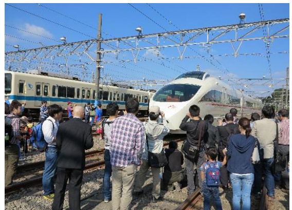
昨年のイベントの様子（一部）