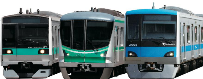
車両展示のイメージ

当社グループのバス会社による車両展示、ステージイベント（音楽、お笑い）、小田急海老名駅長やロマンスカー・VSE乗務員との撮影会、鉄道・バスグッズの販売等を開催します。