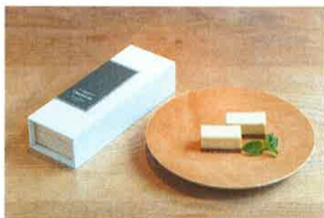
【アールグレイチーズケーキ】