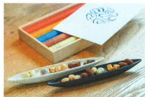
【ビーンズショコラ 5 本桐箱セット】

（エスプレッソビーンズ、アマンドショコラ、マカダミアショコラ、ヘーゼルナッツショコラ、ピスタチオショコラ） 3,880 円（税込）