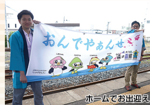
写真は全てイメージです。