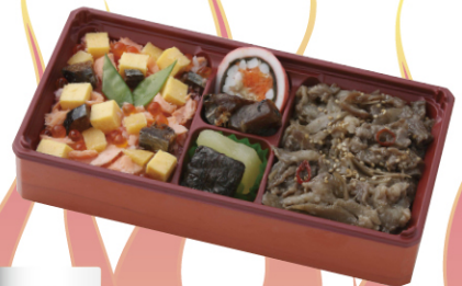
津軽海峡にぐ・さかな弁当